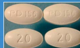
A vastagságuk közötti különbséget leszámítva a hamis Lipitor® (balra) ránézésre megkülönböztethetetlen az eredeti tablettáktól.

„Miközben az Egyesült Királyság törvényes gyógyszerellátási láncja nemzetközi szinten is biztonságosnak számít, tény, hogy nincs olyan ellátási hálózat, ami áthatolhatatlan lenne - bármilyen szabályozó és felügyeleti garanciák is vannak érvényben.”