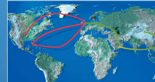
Ez a példa egy 2006-ban a londoni Heathrow repülőtéren elfogott gyógyszer szállítvány alapján készült, amikor is 13.500 hamis Lipitor® tablettát találtak. A nyomozás során fény derült az Egyesült Királyságba vezető összetett belépési útvonalra (sárga vonalak), valamint a valószínűsíthető továbbítási útvonalra is (piros vonalak).

„A törvényes elosztó csatornákat feltörik; illegálisan külföldről átirányított valódi termékeket kevernek össze hamisítványokkal; a behozatali és kiviteli szabályokat megszegik, és fedőcégek segítségével hoznak létre hamis származást, tisztára mosva a hamis gyógyszereket, ezzel beszivároztatva azokat a törvényes ellátási láncba.”